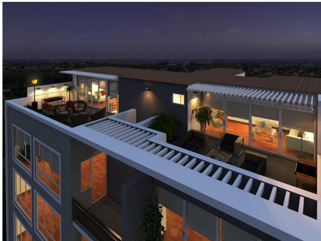
Terrazas (701 y 702)