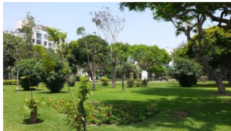
Parque Naciones Unidas