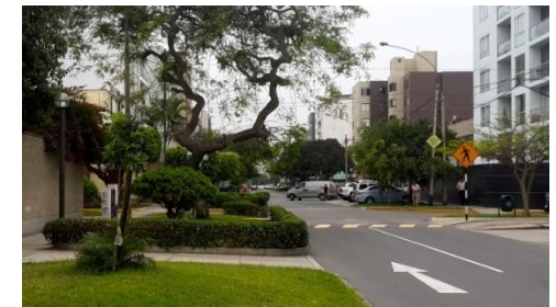
Av. General Córdova